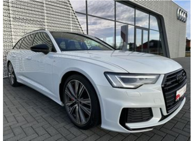
Audi Gebrauchtwagen :plus