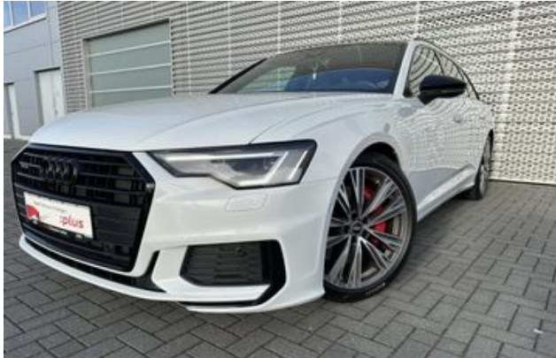
Fritz Thomas GmbH & Co. KG